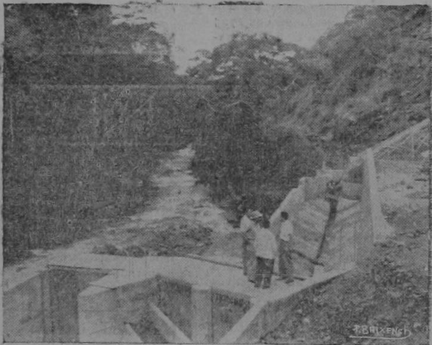
Toma de agua y desarenador